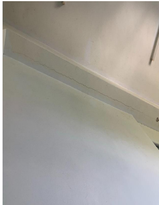
รอยแตกร้าวขนาดเล็ก ที่ผิวปูนฉาบห้องคาน