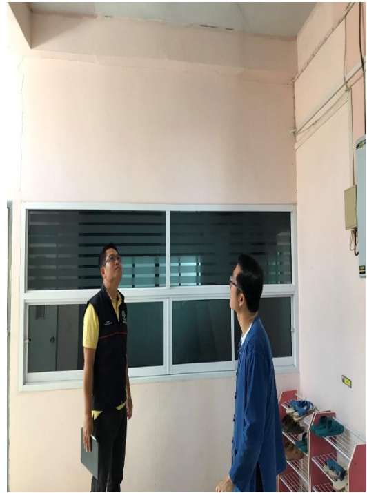
รอยแตกร้าวขนาดเล็ก