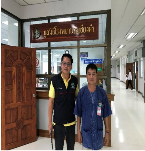
ตรวจสอบร่วมกับหัวหน้าช่าง รพ.