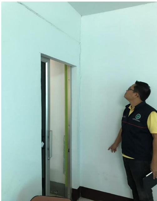
รอยแตกร้าวขนาดเล็ก ระหว่างผนังกับห้องคาน