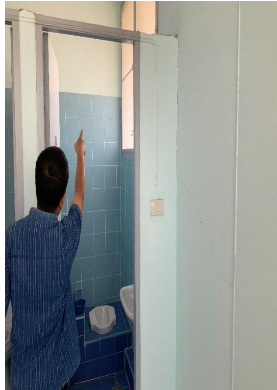
รอยแตกร้าวขนาดเล็ก ระหว่างผนังกับเสา