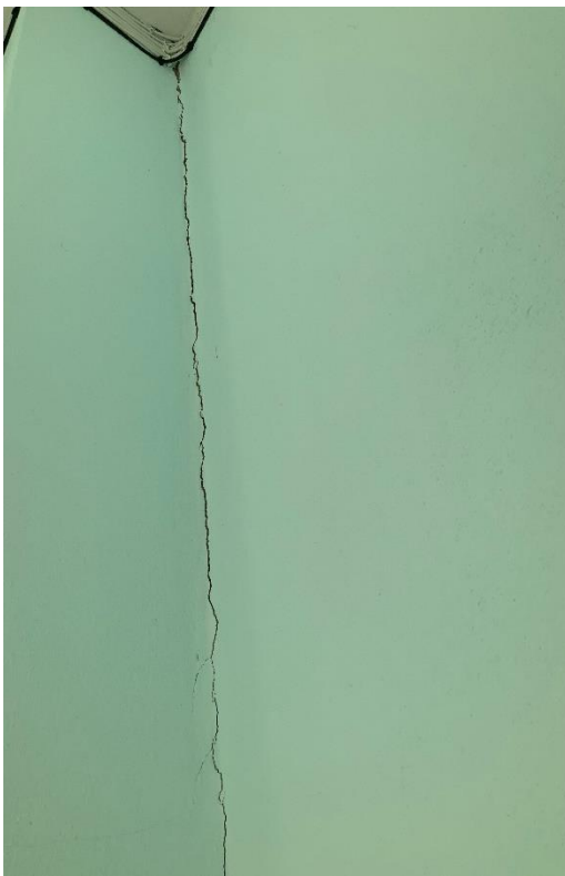
รอยแตกร้าวขนาดเล็ก ระหว่างผนังกับเสา