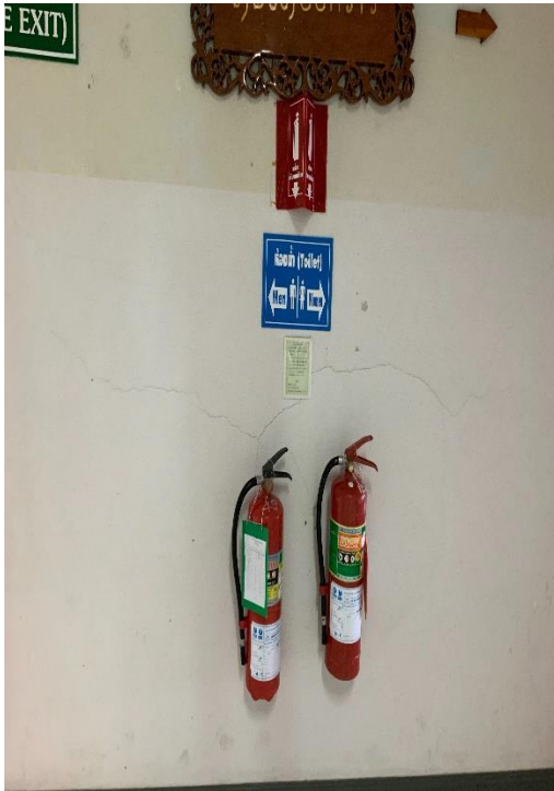
รอยแตกร้าวขนาดเล็ก ที่กลางผนัง