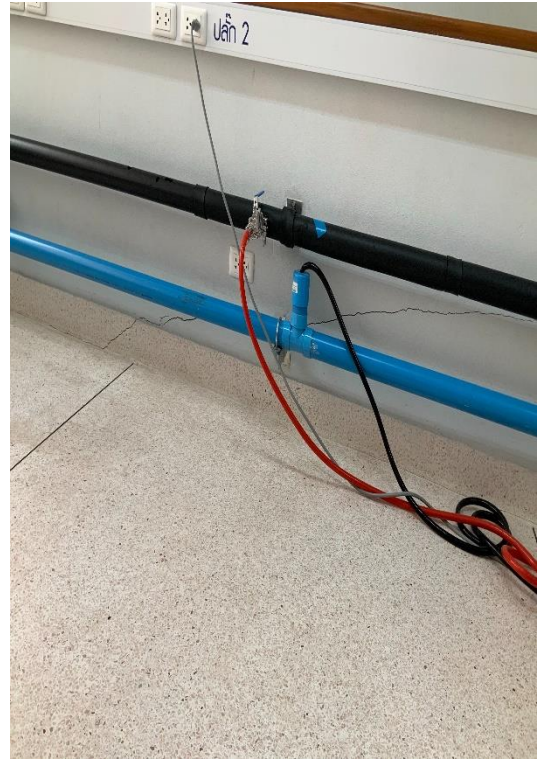
รอยแตกร้าวขนาดเล็ก ที่ขอบผนังช่วงล่าง