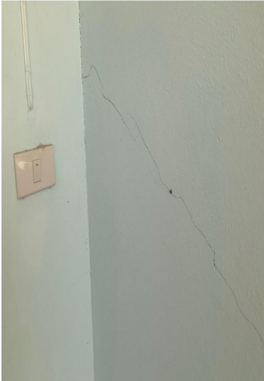
รอยแตกร้าวขนาดเล็ก ที่ผนัง