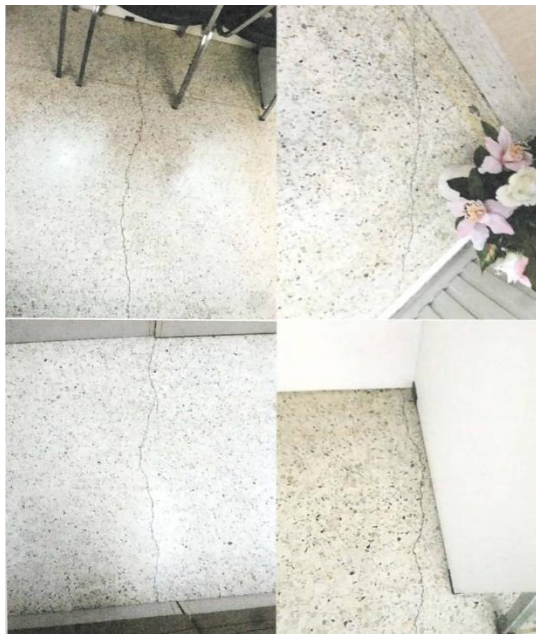
รอยแตกร้าวขนาดเล็กที่ผิวพื้น เป็นรอยร้าวเดิม