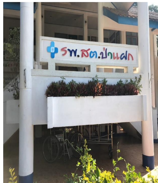
ไม่พบรอยแตกร้าวของโครงสร้าง