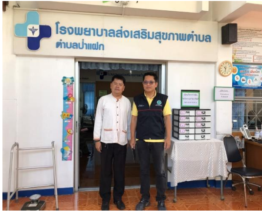
ตรวจสอบร่วมกับ ผอ.รพสต.