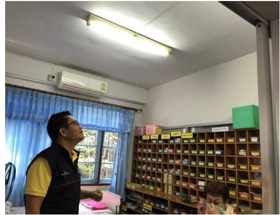
รอยแตกร้าวขนาดเล็กส่วนใหญ่เป็นรอยร้าวเดิม