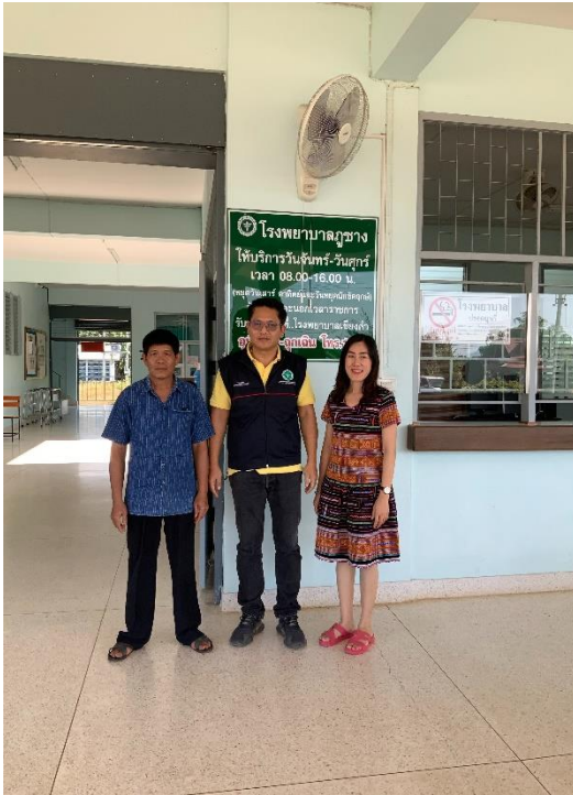
ตรวจสอบร่วมเจ้าหน้าที่ รพ.