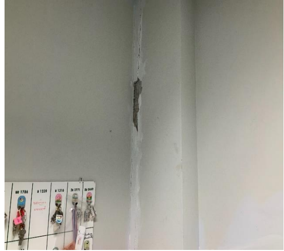
รอยแตกร้าวเดิมที่ขยับตัว ระหว่างผนังกับเสา