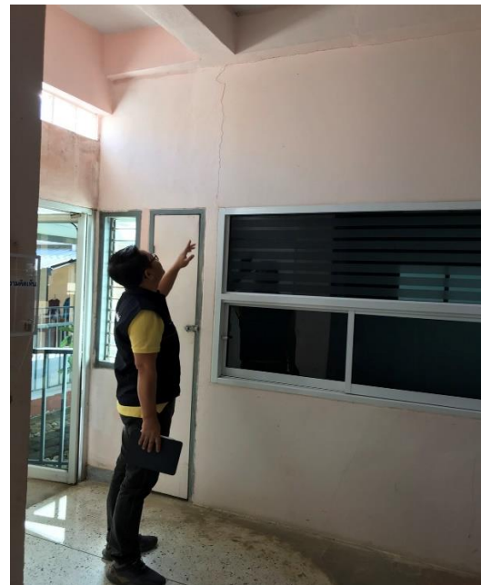
รอยแตกร้าวขนาดเล็ก ระหว่างผนังกับเสา