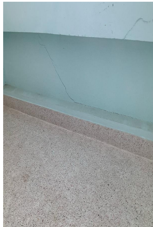
รอยแตกร้าวขนาดเล็ก ที่ขอบล่างผนัง