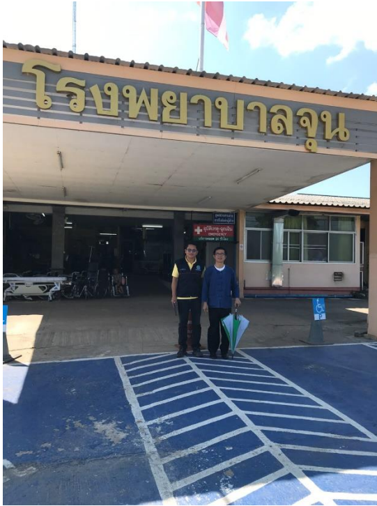
ตรวจสอบร่วมกับ ผอ.รพ.