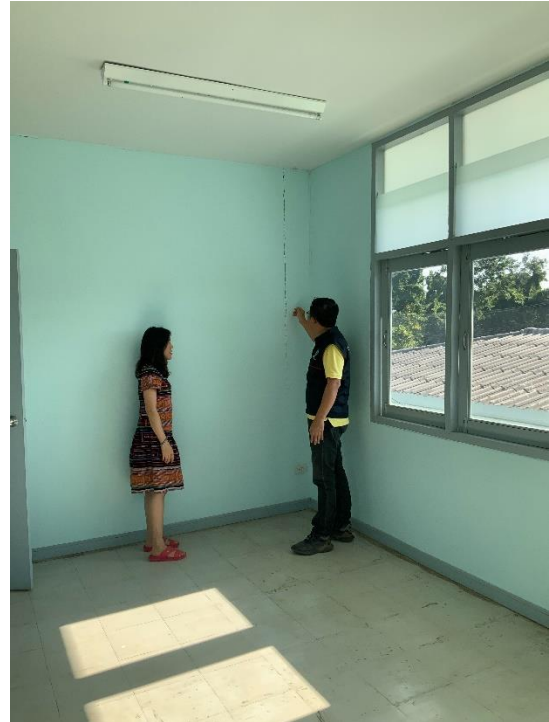
รอยแตกร้าวขนาดเล็กระหว่างผนังกับเสา