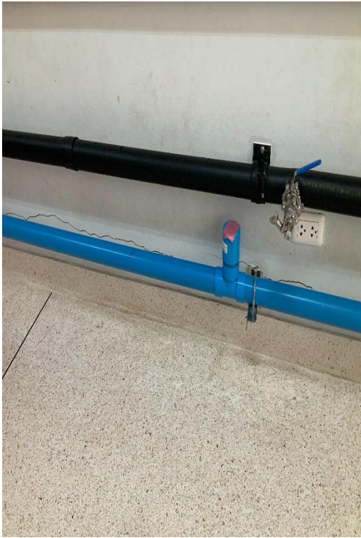
รอยแตกร้าวขนาดเล็ก ที่ขอบผนังช่วงล่าง