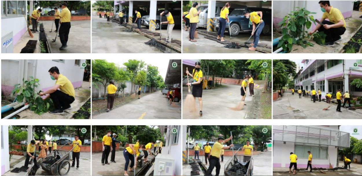
กิจกรรมรวมใจ ร่วมแรงพิชิต Big cleaning Day หน่วยงาน (๒๙-๗-๖๓)

- ได้ดำเนินการจัดให้มีอุปกรณ์ เครื่องมือเครื่องใช้ในการทำงาน และอุปกรณ์เทคโนโลยีที่ทันสมัย เหมาะสม เพียงพอต่อการปฏิบัติงาน